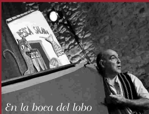
En la boca del lobo

Con máscaras y títeres de diversas técnicas, canciones, cuentos, retahílas, todo remodelado, ensamblado y zurcido para hablar de la cultura popular a través del viejo oficio titiritero. Un itinerario festivo que un titiritero y un músico van recorriendo acompañando al auditorio en un viaje. En los recodos y claros del bosque que atraviesan aparecerán los personajes más “villanos” de nuestras fábulas: el lobo, la bruja, el gigante, el bandido, el duende y el gato. (+ 3años).